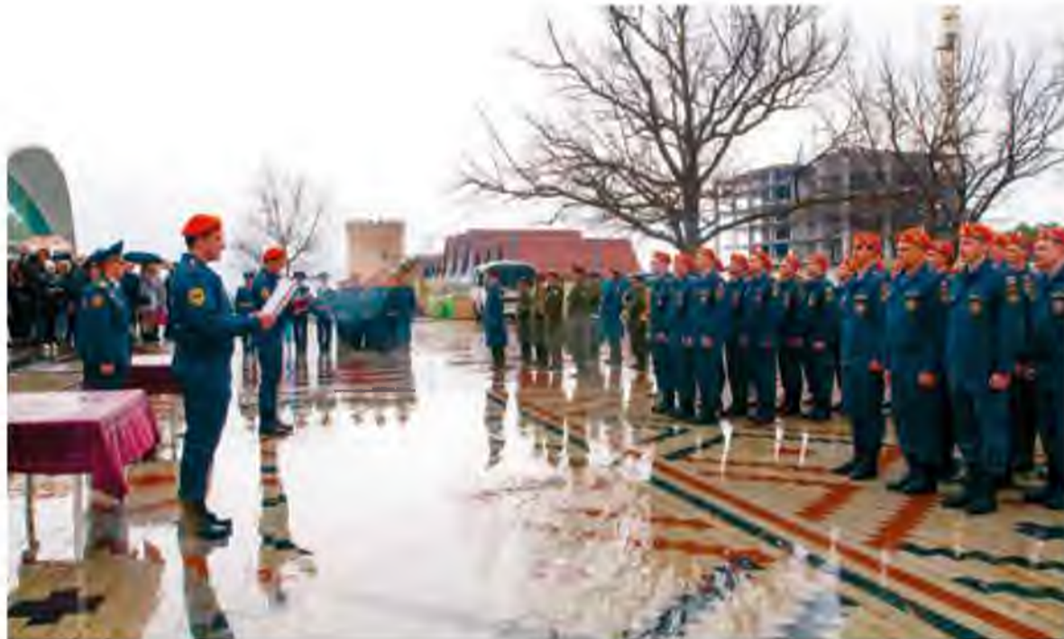
Накануне профессионального праздника молодые пожарные тольяттинского гарнизона приняли присягу

Это был первый в мировой практике опыт создания системы государственной пожарной охраны. Решение молодой советской власти дало импульс бурному развитию пожарной охраны. Началось строительство заводов по производству пожарных автомобилей и техники, появились первые пожарно-технические учебные заведения, готовившие квалифицированных инженеров-специалистов в области пожарной безопасности, стала необходимой разработка норм и правил, нормативной документации. 17 апреля является днём рождения государствен-