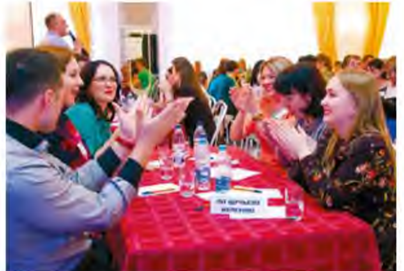
Квиз развивает умение применять интеллект, быстро «включать» смекалку и логику, а главное – быть командой

торы тестировали команды на знание литературы, географии, мировых брендов, музыки и кино. В некоторых турах знатокам приходилось узнавать из динамиков голос Хрущева, вспоминать, как выглядел первый партийный билет Владимира Ленина, на баржах или все-таки дюнах катаются на сноуборде жители Намибии, в других – угадывать, был ли цветок в руках у девочки из фильма «Леон», «Баккара» или «Абба» поют песню «Sorry, Im lady». Было ли сложно? Было захватывающе! Вопросы оказались достаточно продуманными и интересными.