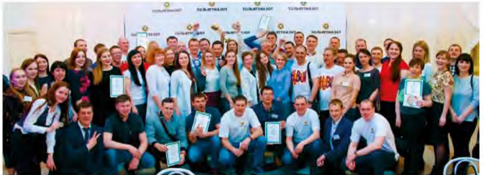
«Квиз», или, по-русски, викторина – командная интеллектуальная игра

– В игре «Квиз» семь туров по семь вопросов, из которых шесть туров – для накопления