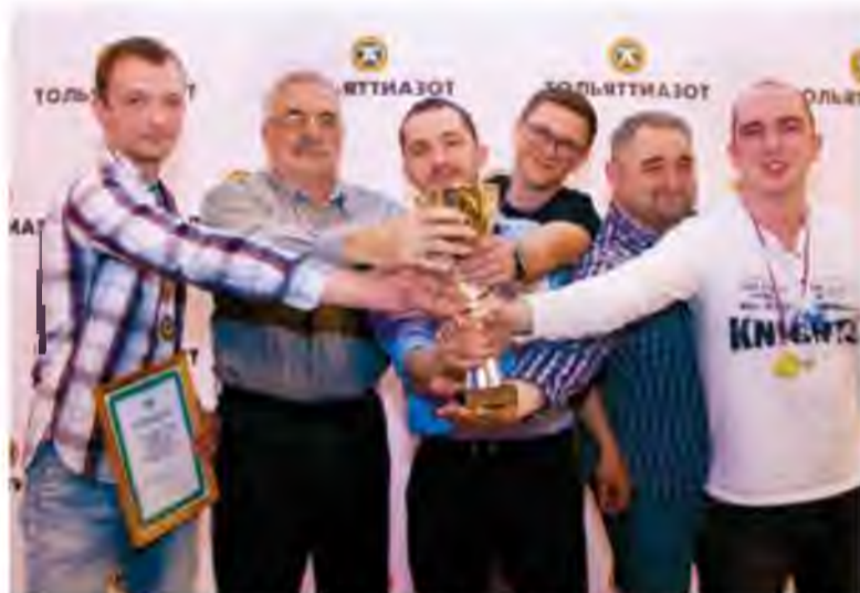
Команда производственников «О3А» стала лучшей в сезоне 2018 года

баллов. А вот седьмой тур – со ставками, и там можно потерять всё, что команда накопила за игру, – рассказывает о правилах ведущий. – Ответили неправильно – минус балл, сделали неверную ставку – потеряли больше. Было такое, что в победу одной команды мало кто верил, а после финального тура именно они забрали главный приз.